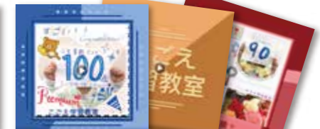
まちなかbizのセミナーで作った動画

まちなか biz あおば(以下まちなか biz)は横浜市青葉区美しが丘(たまプラーザ駅近く)に、ビジネス拠点を提供する会員登録制のコミュニティです。