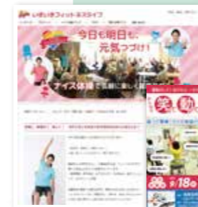
制作したHPとチラシ